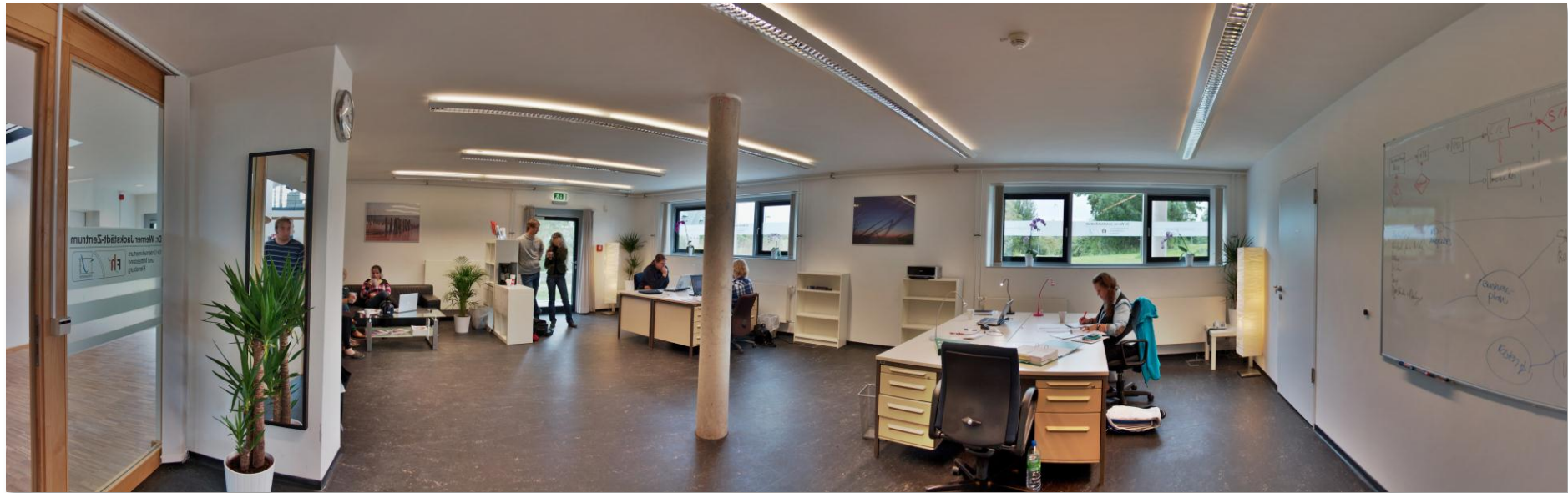
BLICK IN DEN GRÜNDERRAUM DES JACKSTÄDT ENTREPRENEURSHIP CENTERS