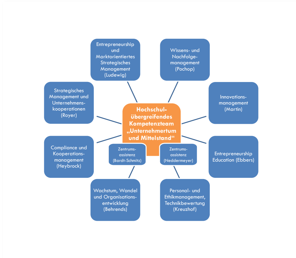
ORGANISATIONSSTRUKTUR UND ARBEITSBEREICHE DES DR. WERNER JACKSTÄDT-KOMPETENZZENTRUMS (SEIT 2012)