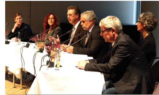
DISKUSSIONSRUNDE IM RAHMEN DES FLENSBURGER FORUMS FÜR UNTERNEHMERTUM UND MITTELSTAND

Präsentation des „ Dr. Werner Jackstädt-Kompetenzzentrums “ auf der „Campuswelt 2012“, veranstaltet durch die Flensburger Hochschulen, Flensburg, Juni 2012 (alle Zentrumsmitglieder)