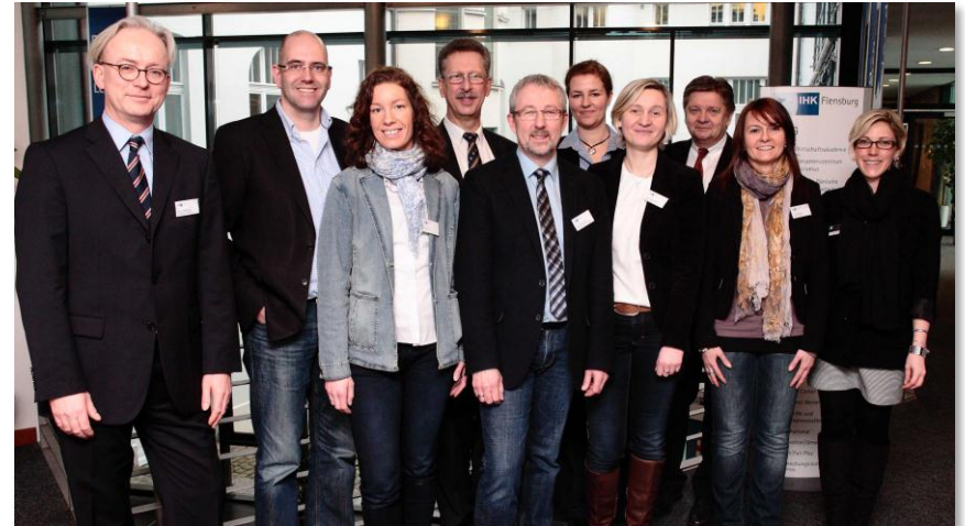
EXPERTEN-WORKSHOP IM PROJEKT „WAL NORD“ IN DER IHK ZU FLENSBURG

INA: Innovative Arbeitsgruppenkonzepte zur Integration von Informatik und beruflicher Selbstständigkeit von Frauen , gefördert durch das BMBF und den Europäischen Sozialfonds für Deutschland, Juni 2011 bis August 2012 (Ebbers)