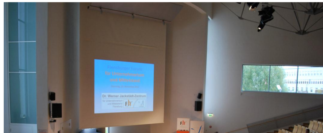
DAS DR. WERNER JACKSTÄDT-KOMPETENZZENTRUM IN FLENSBURG VERANSTALTET DAS FLENSBURGER FORUM FÜR UNTERNEHMERTUM UND MITTELSTAND