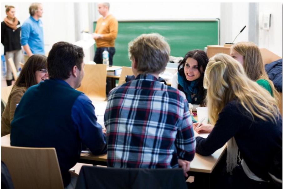
STUDENTISCHE TEILNEHMERINNEN UND TEILNEHMER WÄHREND EINES GRÜNDUNGSWORKSHOPS IM RAHMEN DES INTERREG-PROJEKTES „SPICE“ IM NOVEMBER 2012