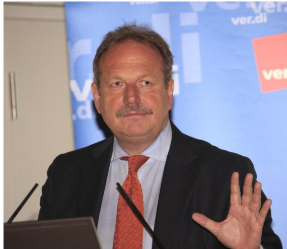
HERR FRANK BSIRSKÉ, VORSITZENDER DER GEWERKSCHAFT VER.DI, SPRICHT IM AUDIMAX DES FLENSBURGER HOCHSCHULCAMPUS

Wie schon im vergangenen Jahr ist auch das Geschäftsjahr 2012/2013 durch einen erneuten Ausbau der Aktivitäten des „Dr. Werner Jackstädt-Kompetenzzentrums“ in den drei Kernbereichen Forschung, Wissenstransfer und Lehre gekennzeichnet. Durch das aktive und engagierte Wirken aller Zentrumsmitglieder ist es gelungen, weiterhin positive Impulse in der Region zu setzen und das „Dr. Werner Jackstädt-Kompetenzzentrum für Unternehmertum und Mittelstand Flensburg“ als feste Größe innerhalb der Flensburger Wissenschaftslandschaft zu verankern.