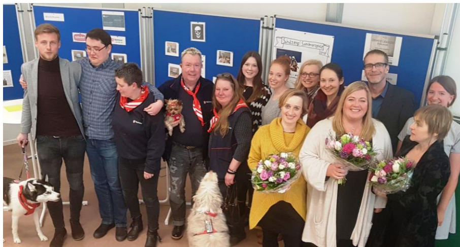
FEIERLICHE ABSCHLUSSVERANSTALTUNG DES ZWEITEN SERVICE-LEARNING PROJEKTES

ERFOLGREICHER ABSCHLUSS IM PROJEKT “ETHIK-, QUALITÄTS-, COMPLIANCE-MANAGEMENT FÜR DIE LEBENSMITTELBRANCHE IM MITTELSTAND IN SCHLESWIG HOLSTEIN - LEBENSMITTEL-EQ.COM” AM 13.02.2018. IN DIESEM INTERDISZIPLINÄREN PROJEKT GALT ES DEN VERBRAUCHER-, ARBEITS- UND UMWELTSCHUTZ DER REGIONALEN LEBENSMITTELUNTERNEHMEN DURCH DIE ENTWICKLUNG UND ERPROBUNG PRAXISORIENTIERTER INSTRUMENTE DES NACHHALTIGKEITSMANAGEMENTS ZU UNTERSTÜTZEN.