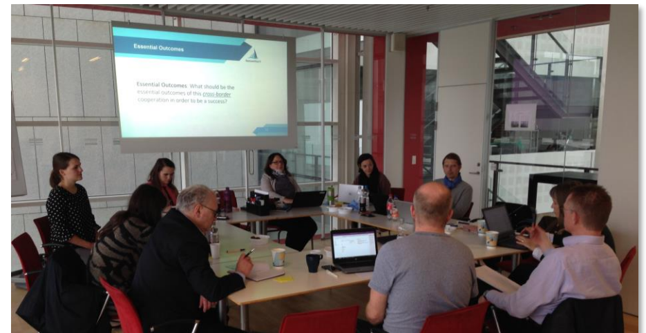
VENTUREWÆRFT STRATEGIE WORKSHOP I