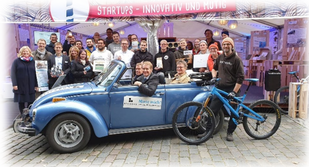
FOTO: START-UPS AM TAG DER DEUTSCHEN EINHEIT (ARCHIV START-UP SH)

Neben der VentureWærft hat sich auch über die Region Flensburg hinaus viel in der hochschulnahen Gründungsförderung getan. Zusammen mit zahlreichen Partnern aus dem 2017 gegründeten Verein „StartUp Schleswig-Holstein e.V.“ (kurz: StartUp SH) war das DWJZ beispielsweise mit gleich zwei Projekten auf dem Kieler Waterkant Festival, dem wohl größtem Start-Up Festival in Norddeutschland, vertreten. Mit einer eigenen „Green