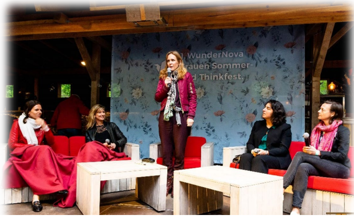
WUNDERNOVA SOMMERFEST IN BERLIN