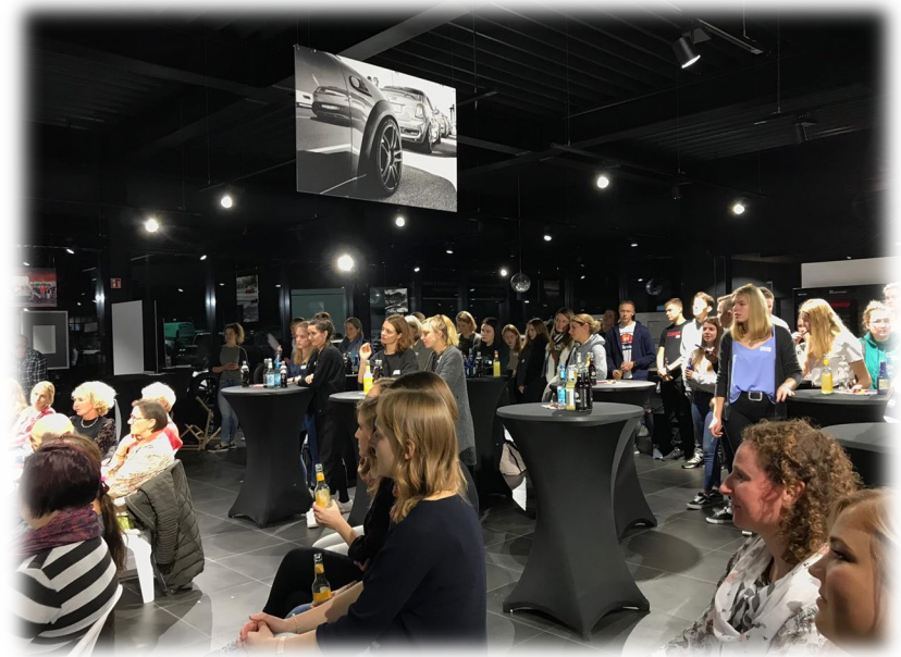
FOTO: #WINSPIRE STARTUP TALK MIT TJORVEN REISENER (KIRSTEN MIKKELSEN)

Dann folgen Sie uns auf Facebook unter #WEstartupSH oder besuchen Sie uns unter www.westartup.sh