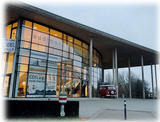
DIE CONVENTURE MIT IHREM START-UP PIER IM FOYER DES FLENSBURGER AUDIMAX