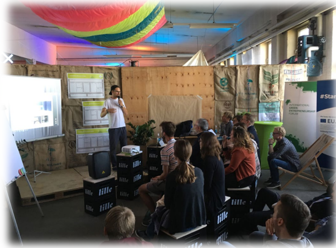
FOTO: WATERKANT FESTIVAL 2018 (THOMAS ...) grenzübergreifend im dänischen Sønderborg statt. Zurück in Flensburg konnte die „Sommer-conVenture“ dann in einem mit rund 300 Teilnehmenden gefülltem Audimax auf der „conVenture“ im Wintersemester 2018 noch getoppt werden.

Als Initiative der regionalen Gründungsunterstützer, der Europa-Universität Flensburg (EUF) und der Hochschule Flensburg (HSF) (Dock1), der IHK Flensburg (Dock2) und der WiREG/Technologiezentrum (Dock3) wurde die VentureWærft 2016 gegründet und 2018 um die dänischen Partner, die Syddansk Universität Sønderborg (Dock4) sowie Sønderborg Iværksætter Service (Dock5), erweitert. Im Sommer 2018 war es dann das erste Mal soweit und das Aushängeschild der VentureWærft, die „conVenture – nordic start-up convention“, fand mit rund 140 Teilnehmenden erstmalig wahrhaft