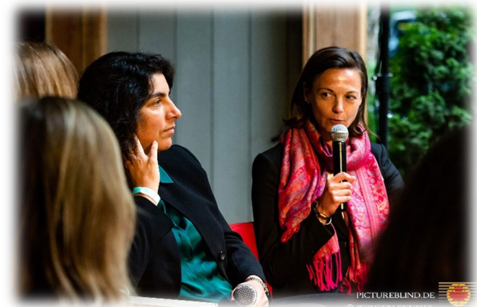
FOTO: WUNDERNOVA SOMMERFEST IN BERLIN