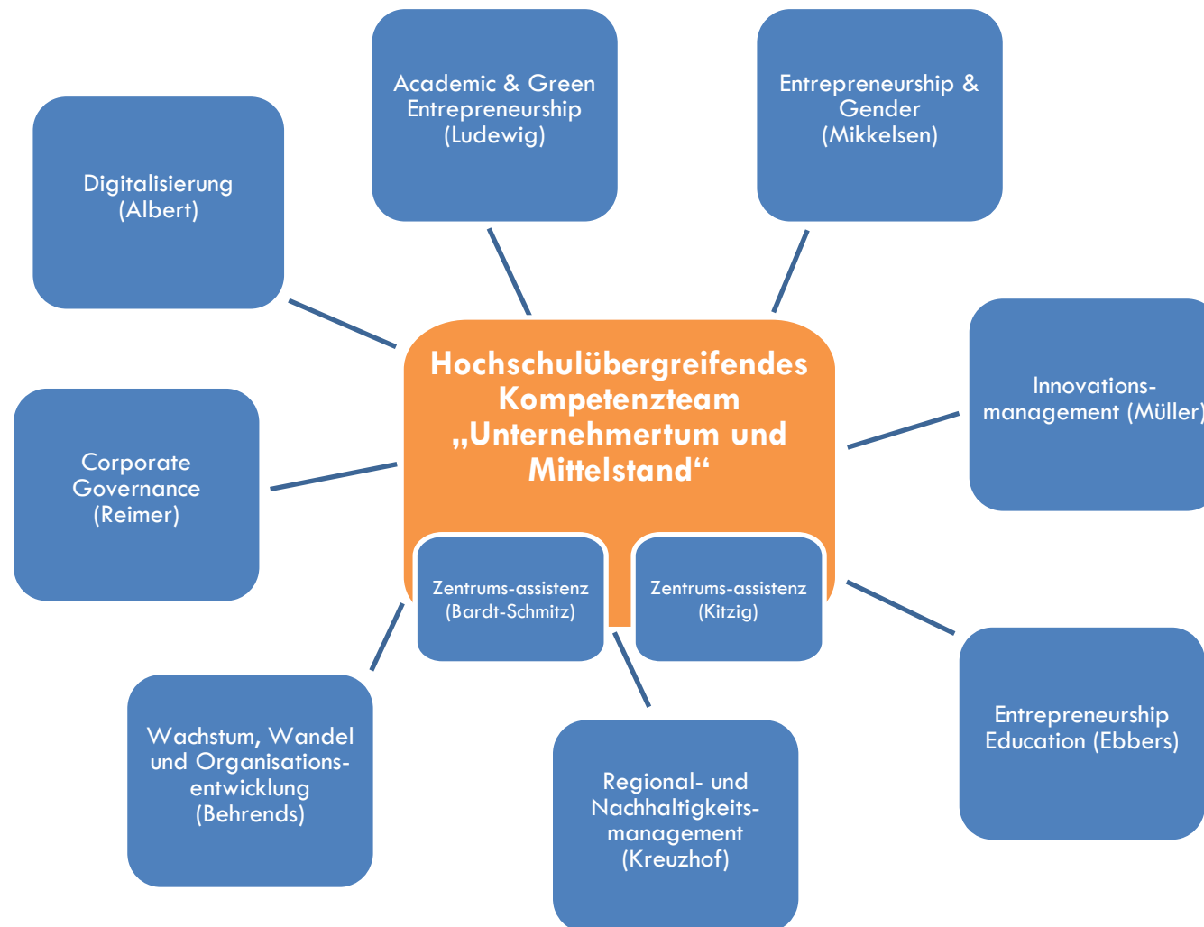
ORGANISATIONSSTRUKTUR UND ARBEITSBEREICHE DES „DR. WERNER JACKSTÄDT-ZENTRUMS“ (JUNI 2020)