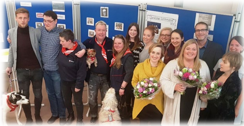
FOTO: ABSCHLUSSVERANSTALTUNG SERVICE-LEARNING PROJEKT (TANJA REIMER)

Flensburg weist nun das landesweit größte Bonusprogramm für ehrenamtlich engagierte Bürgerinnen und Bürger auf und setzt sich mit „Löwenherz“ geschlossen gegen häusliche Gewalt gegenüber Kindern und Jugendlichen ein. Die Unterstützung haben die Studierenden den gemeinnützigen Organisationen im Rahmen des Projektseminars „Service Learning“ am Internationalen Institut für Management und ökonomische Bildung (IIM) zukommen lassen. Am 14.11.2018 wurde der erfolgreiche Abschluss des Projekts öffentlich gefeiert.