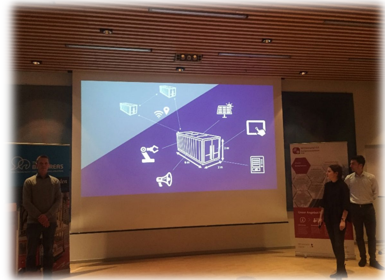
FOTO: ABSCHLUSSPRÄSENTATION MOBILE CONTAINER SOLUTIONS, IHK KIEL